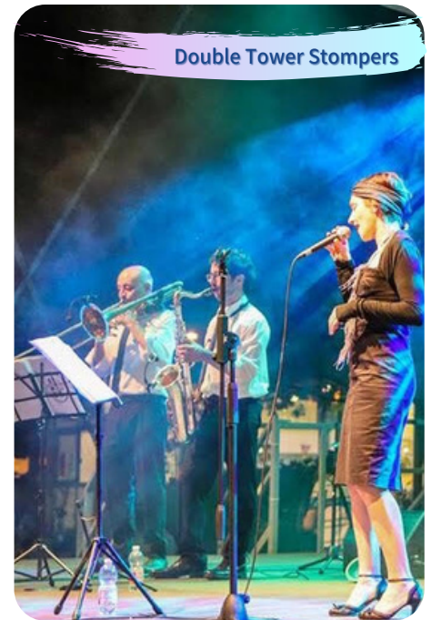
Double Tower Stompers

A Rastignano, seguendo i pilastri devozionali, per conoscere le bellezze della frazione fra storia e visita ai luoghi religiosi | Partenza ore 16 | Costo euro 5 per assicurazione | a cura di www.walkingvalley.it | Info e prenotazione Monica 3394629936